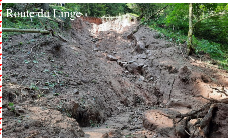
Route du Linge